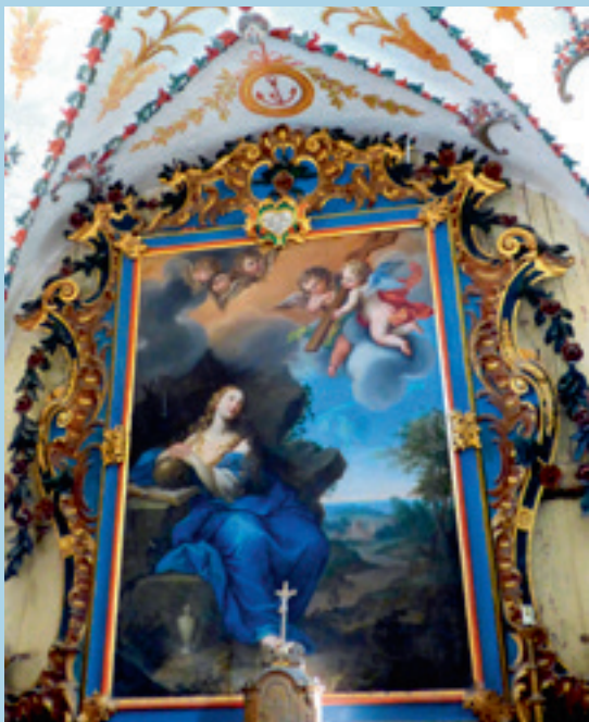
Chapelle Ste M. Madeleine à Nancroix

L'église de Peisey, les 14 oratoires de son cimetière et le sanctuaire N-D des Vernettes sont classés aux Monuments Historiques. Le tableau de la chapelle de Nancroix figure à l'inventaire complémentaire.