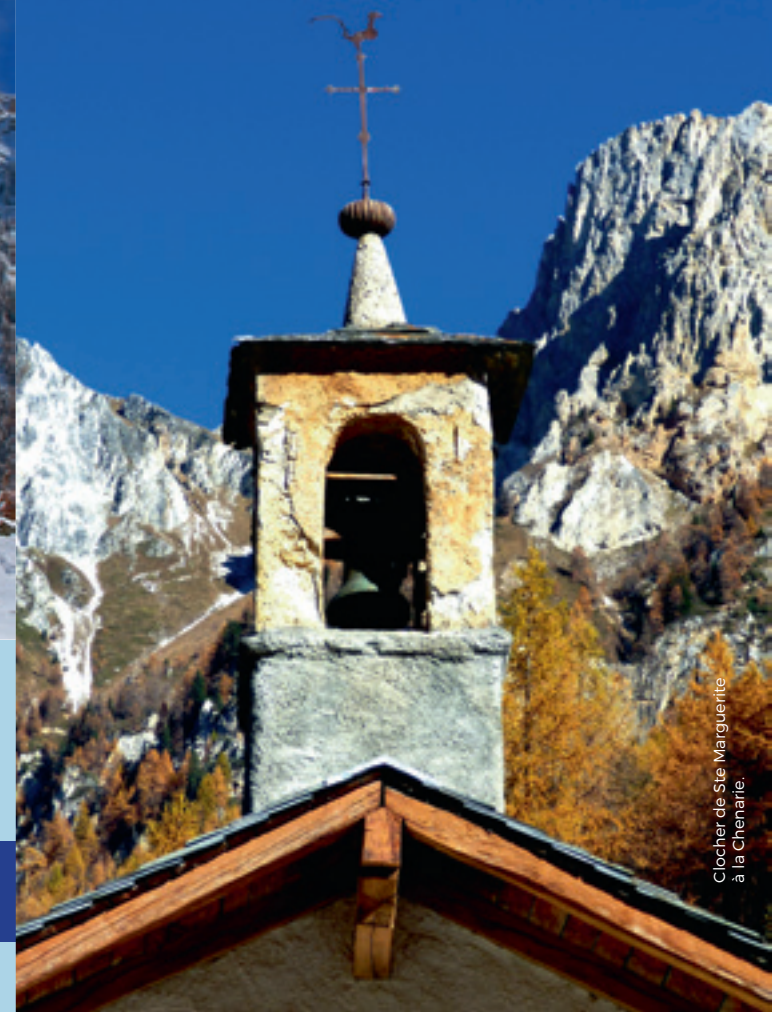
Clocher de Ste Marguerite à la Chenarrie.

Ce travail a été fait dans le cadre d'un Master "valorisation et médiation du patrimoine" par E. Bourjade, L. Léger, et C. Ruckly-Clo.