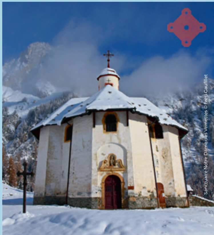
Sanctuaire Notre Dame des Vernettes